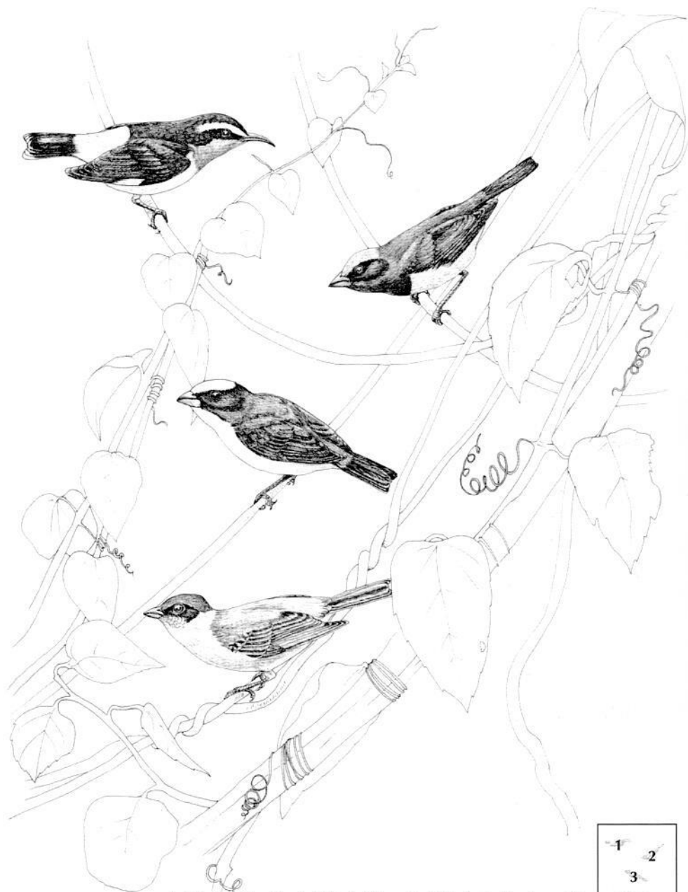
1. Mielero Común, 2. Eufonia Saturada, 3. Eufonia Gorgiamarilla, 4. Tangara Rastrojera.