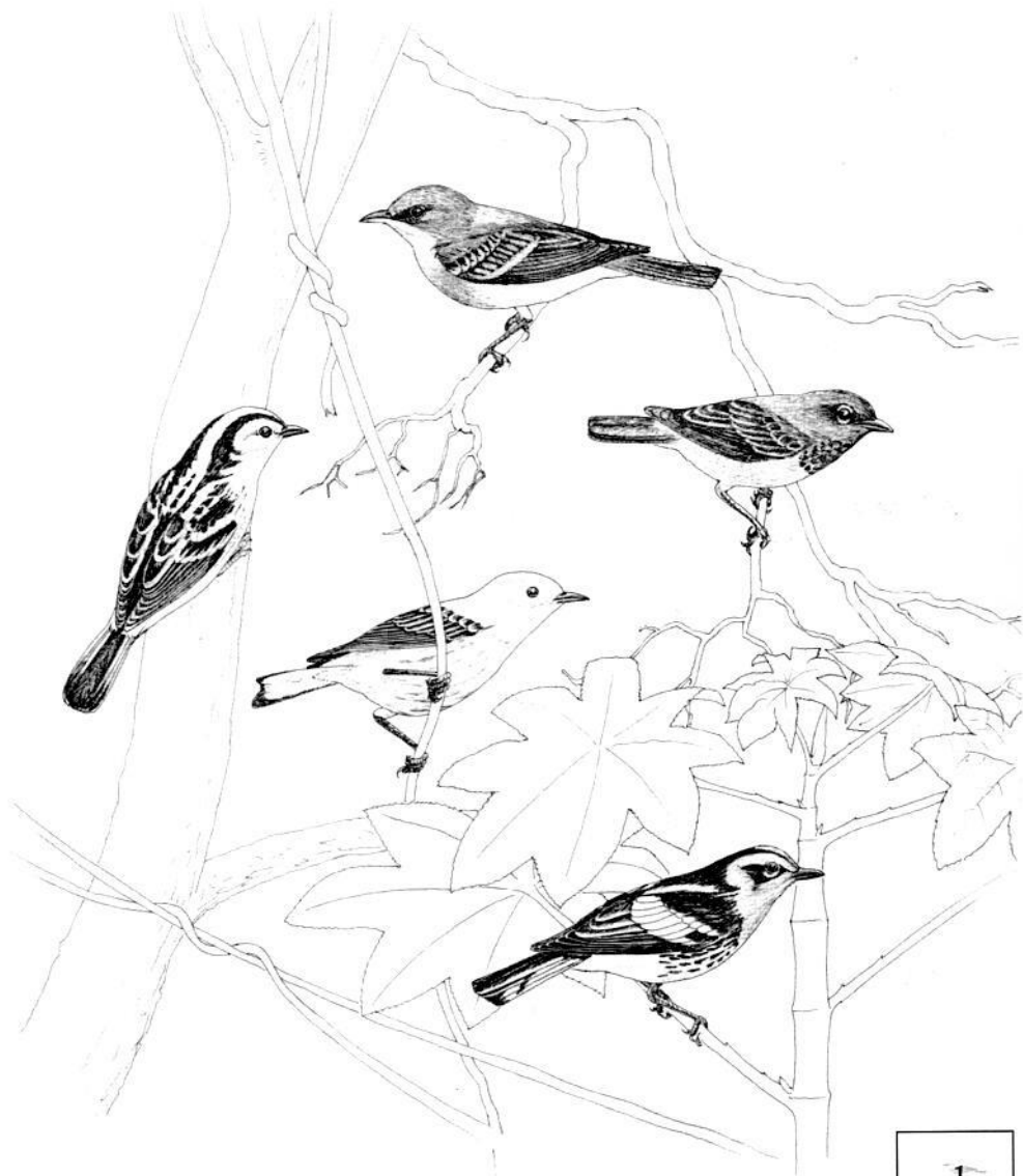
1. Reinita Tropical, 2. Reinita Trepadora, 3. Reinita Enlutada, 4. Reinita Amarilla, 5. Reinita Naranja.